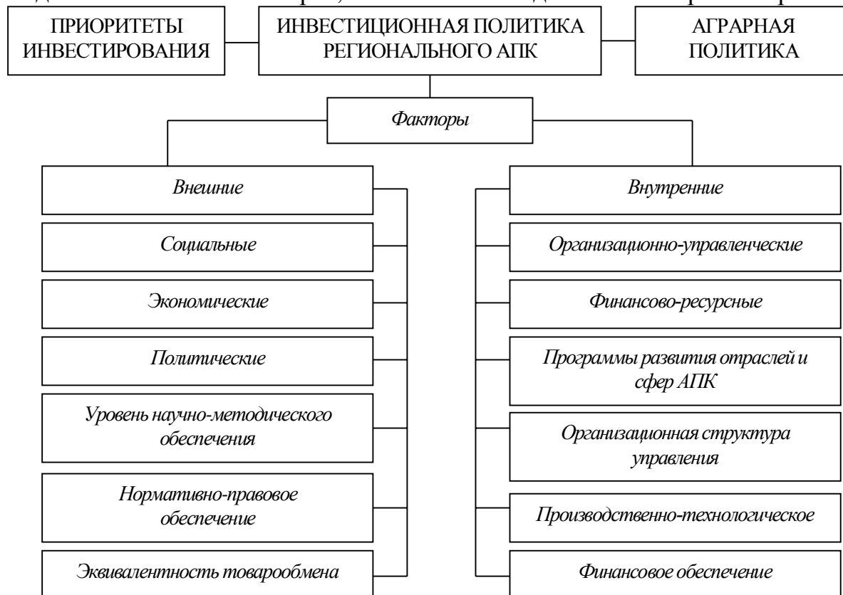
Рис. 1. Схема взаимодействия факторов в рамках инвестиционной политики регионального АПК

первом этапе реализации проекта следует ориентироваться на капитальные вложения в перерабатывающую промышленность. При этом возможна закупка сырья на свободном рынке. Следовательно, при выборе будущей производственной программы следует учитывать долю сырья в той или иной перерабатывающей отрасли. Те виды продукции, в которых стоимость сырья превышает розничную цену на готовую продукцию или не обеспечивает компенсации производственно-сбытовых затрат, исключается из дальнейшего рассмотрения.